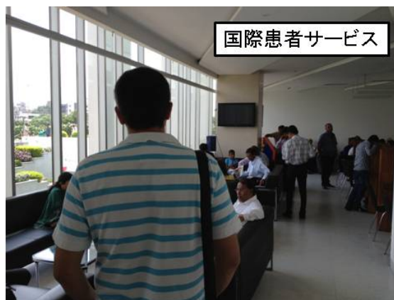
国際患者サービス